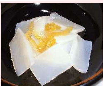
柚子味こん こんにやく、ゆず