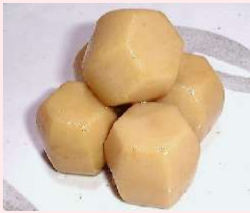
六方里いも 里いも