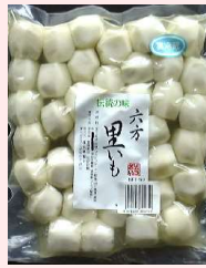
850g × 2 × 5 約30粒 要冷蔵