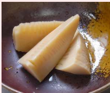
特選たけのこ煮 竹の子