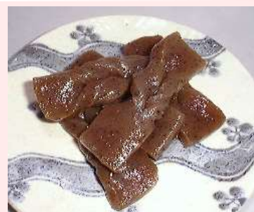
ひねりこんにやく こんにやく