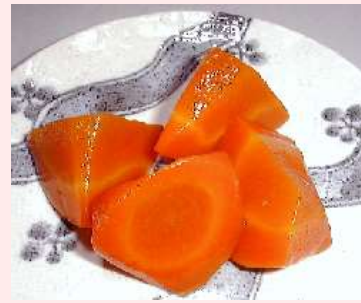
味付人参 (乱切) 人参