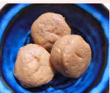
がんもの含め煮 がんも