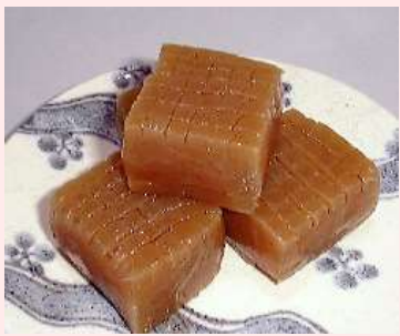
こんにやく鹿ノ子 こんにやく