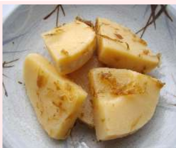
かつお筍 (银杏カット) 約85切 竹の子、かつお節