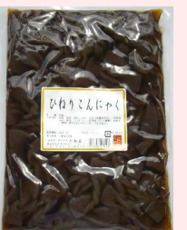
1kg × 16 約80個