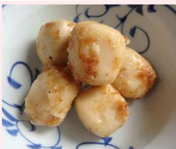
里いも土佐煮 里いも、かつお節