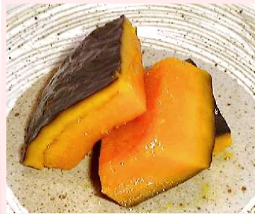
かぼちゃ煮 かぼちゃ