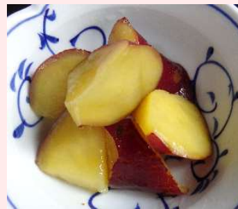
乱切さつまいも 国産さつまいも