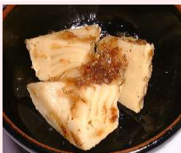
竹の子土佐煮 竹の子、削り節