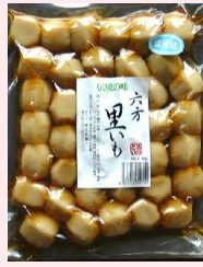
850g × 2 × 5 約30粒 要冷蔵