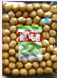
850g × 2 × 5 約60粒 要冷蔵