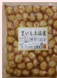
850g × 10 約60粒 要冷蔵