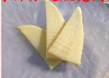
味付トッピング焼 竹の子