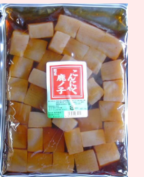
1kg × 10 約38個 要冷蔵