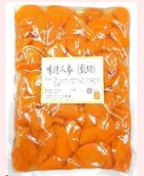
1kg × 10 約80個 要冷蔵