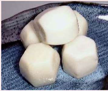
六方里いも 白 里いも