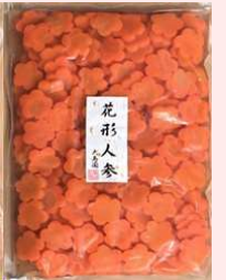
1kg × 15 約150個 要冷蔵