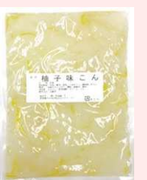
500g × 30