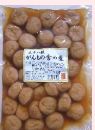
1kg × 10 約38個 要冷蔵